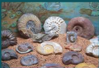
Réalisation Club Dauphinois de Minéralogie et Paléontologie de Grenoble et Centre de Géologie de l'Oisans.

Une quatrième vitrine est consacrée aux Ammonites et à leur grande diversification durant toute cette ère.