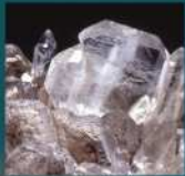
Quartz à âme