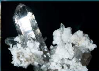
Quartz sur Albite