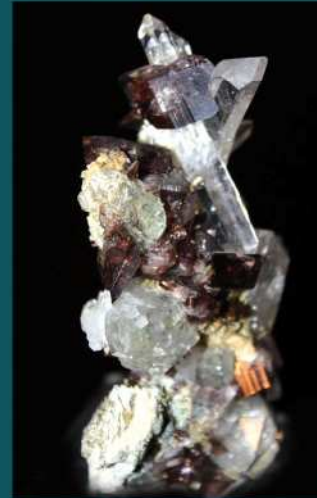
Axinite et Quartz