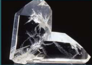
Macle de Quartz